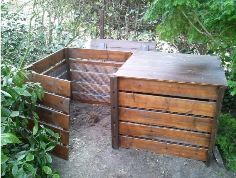
* dubbele compostbak met losse voorkant en deksel (let op het kippengaas aan de binnenzijde)

Composteren op de eigen tuin heeft vele voordelen. Het is eenvoudig, goedkoop, voorkomt een hoop gesleep met groenafval en vormt een geschikt leefmilieu voor allerlei nuttige tuindiertjes. Het hoort dan ook bij uitstek bij natuurlijk tuinieren.